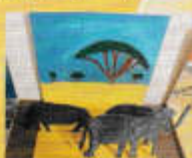
支援級 「動物スタンド」