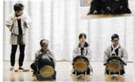
演奏と演舞・栗谷太鼓