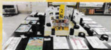
3年 「修学旅行パンフレット」