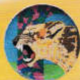
3年 「モザイクアート」