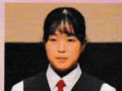
国語科弁論(3年) 【誰かのために】