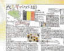
1年 「国調べレポート」