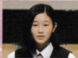
国語科弁論(2年) 【普通の家族】