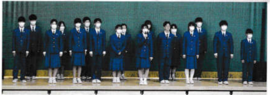
生徒会引き継ぎセレモニー

はじめて人前で歌ったのですが、緊張よりも楽しさやみんなの温かさが大きくて、すこうれしかったです。ありがとうございました。