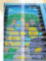
美術部1年 共同制作 「階段アート」