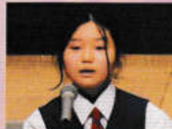
国語科弁論(1年) 【「頑張る」ということ】