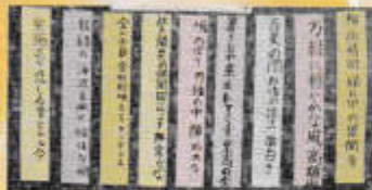
3年 「修学旅行の俳句」