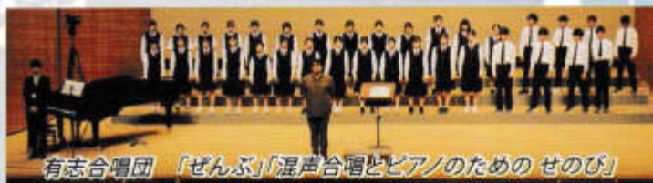
有志合唱団 「ぜんぶ」「混声合唱とピアノのための せのび」