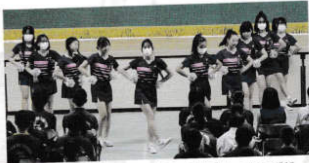
チアダンス・女子ソフトテニスチアリーディング部