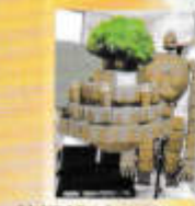
美術部2年 共同制作 立体アート「ラピュタ」