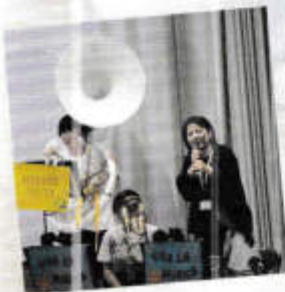
吹奏楽・Ring of sound