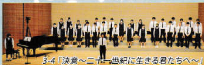
3-4「決意～二十一世紀に生きる君たちへ～」