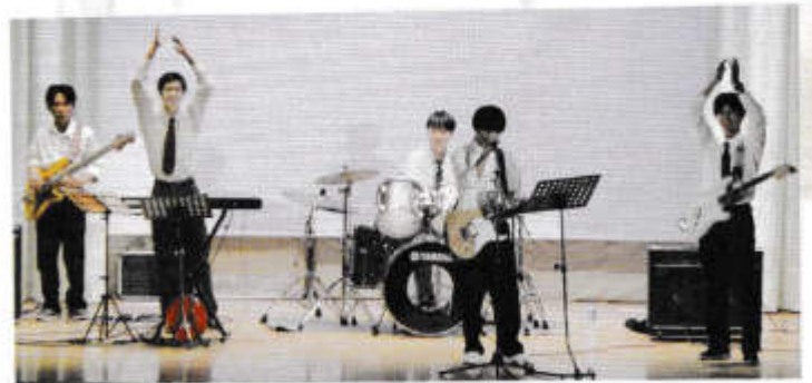
演奏・South life field