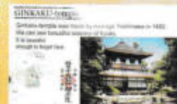
3年 英語「School Trip Reflection」