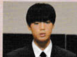
英語科スピーチ 【Hopes and Dreams 夢と希望】