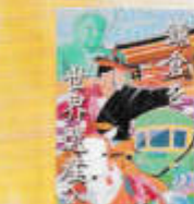
3年 「文化財保護ポスター」 2023年度「世界遺産登録をめざす鎌倉」部門 最優秀賞