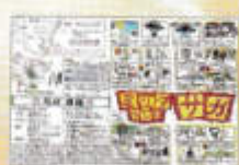
2年 「都道府県調べレポート」